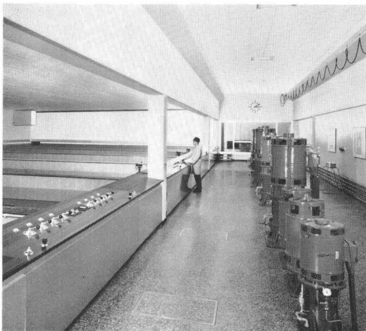
Schnellfilteranlage «Champ-Bougin» der Stadt Neuenburg für das Aufbereiten von Seewasser zu Trinkwasser. Leistung 1800 m 3 /h