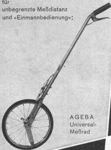
AGEBA Universal- Meßrad

für unbegrenzte Meßdistanz und «Einmannbedienung»: