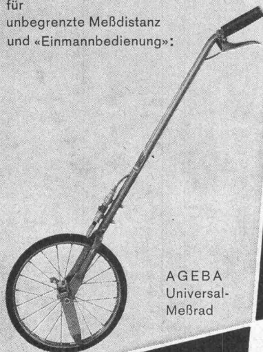
AGEBA Universal- Meßrad