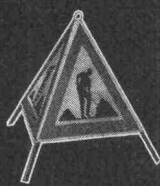
Gefahren-Faltsignale aus wetterbeständigem Plastic-Gewebe

Die Namensliste der gebräuchlichen Messgeräte würde dieses Inserat überfüllen. So zeigen wir hier nur einen Querschnitt davon.