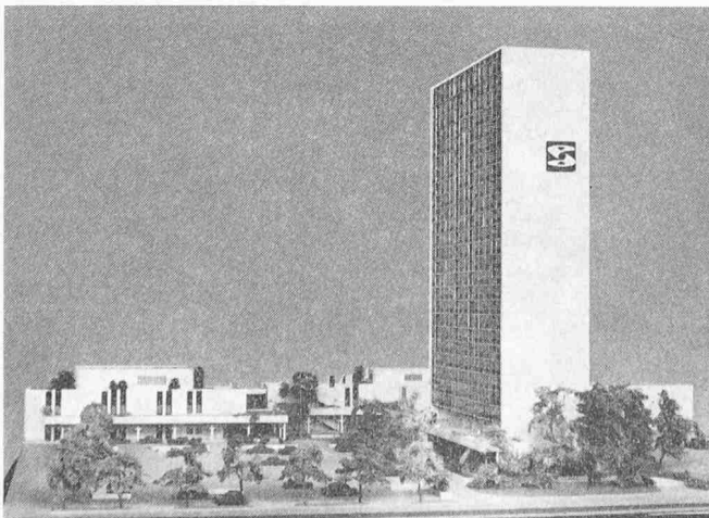
Einkaufszentrum Spreitenbach mit Hochhaus (Modellansicht)

Der Zusammenhang der vier Installationsgebiete Heizung, Lüftung, Sanitär und elektrische Installationen erweist eindeutig die Notwendigkeit enger Zusammenarbeit. Der Sanitäringenieur liefert die Durchschnits- und Spitzenverbräuche für das Warmwasser. Hier zeichnen sich Verschiebungen der Spitzenzeiten ab, infolge der Fünftagewoche und dem Wachstum der Vorortsgemeinden mit vorwiegender Wohnbevölkerung. Die Behandlung von Warm- und Heizungswasser wird immer notwendiger. Heizungs- und Ventilationsingenieure arbeiten bereits im Vorprojektsstadium eng zusammen – Lüftungssysteme, Wärmebedarf, Grundlast, Spitzenbedarf, Kühllast. Die Qualität des Befeuchtungswassers muss zwischen Lüftungs- und Sanitärman abgesehen werden.