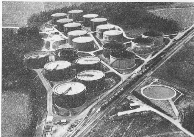
Gesamtansicht der Grosstankanlage der Carbura in Altishausen

Im Hinblick auf einen Brandausbruch oder andere Katastrophen ist die Anlage weitgehend unabhängig von Wasser-