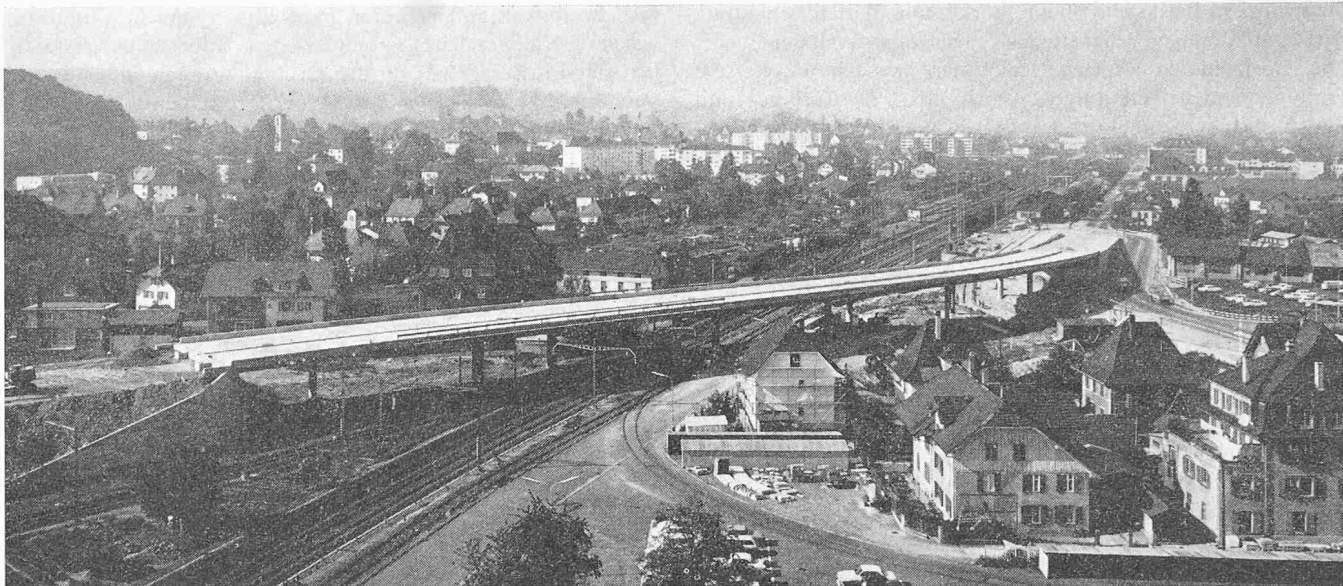
Überführungsbauwerk Aarmatt in Zuchwil