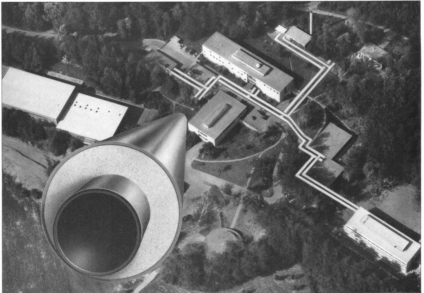
Mit Hartmoltopren verlegte Rohre beim Max-Planck-Institut für Kernphysik in Heidelberg. Freigegeben durch Regierungspräsidium Nordbaden Nr. 10/2233.