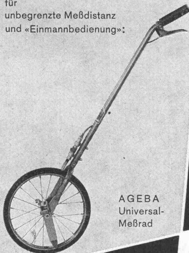
AGEBA Universal- Meßrad