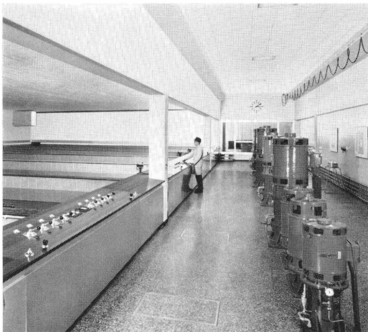
Schnellfilteranlage «Champ-Bougin» der Stadt Neuenburg für das Aufbereiten von Seewasser zu Trinkwasser. Leistung 1800 m 3 /h