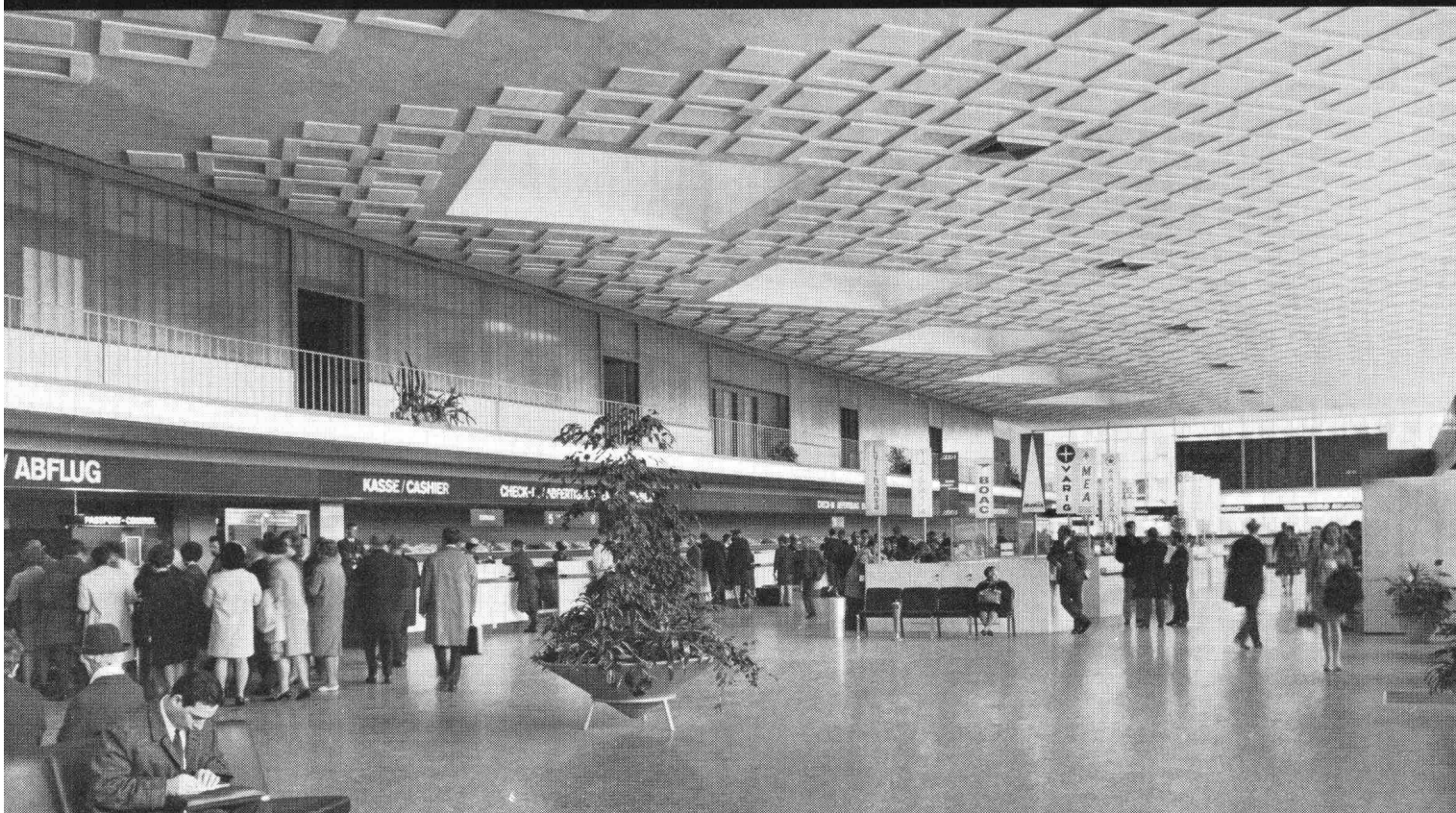
Flughafen Zürich Abflughalle Trakt Nord Bauleitung: Flughafen-Immobilien-Gesellschaft, Zürich