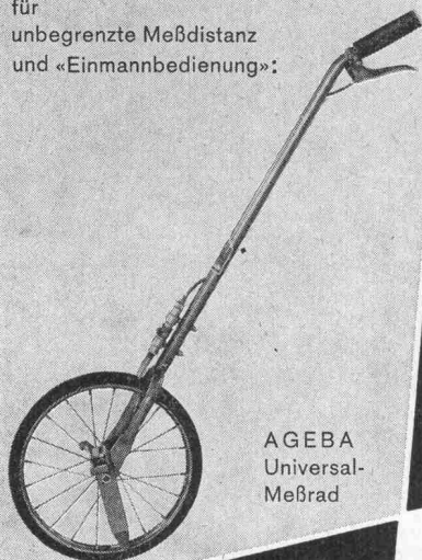
AGEBA Universal- Meßrad

für unbegrenzte Meßdistanz und «Einmannbedienung»: