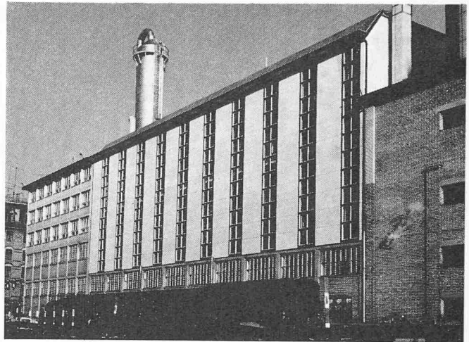
Bild 3. Ansicht von der Hardstrasse

Da die Wandelemente Polymur und Fenster in sehr grossen Teilstücken hergestellt wurden, konnte die Stahl-