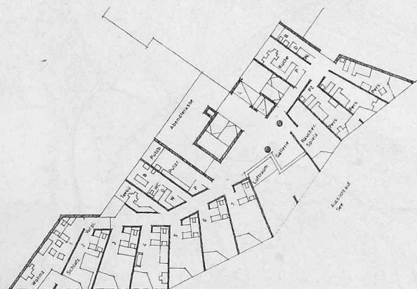
Erstes Obergeschoss C, 1:300

Entschiedene städtebauliche Stellung. Beste Lösung hinsichtlich Besonnung, Seesicht (diese zum Nachteil der Besonnung nicht überbewertet!), Aussicht, Einbezug der näheren Umgebung, Lärmabschirmung und Windschutz. Gute Bewertung von Baumassen, räumliche Gestaltung (zu schmale Personalzimmer), Wirtschaftlichkeit (Aufbau, konstruktive Durchbildung). Kompakte Anlage mit Auffächerung.