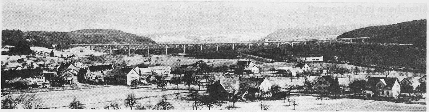
Das Aaretal mit der Hochbrücke bei Brugg, von Villnachern aus gesehen (Photomontage)