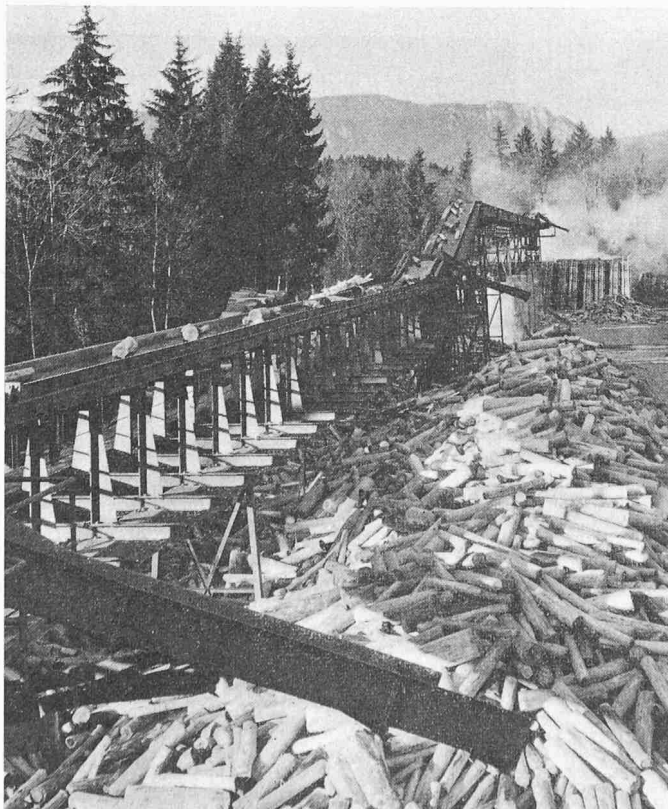
Bild 2. Teilansicht einer 170 m langen Förderanlage für Papierholz in einer Papierfabrik

bewegt und einer Waage zugeführt. Die Steuerung ist programmiert, die Anlage arbeitet also vollautomatisch.