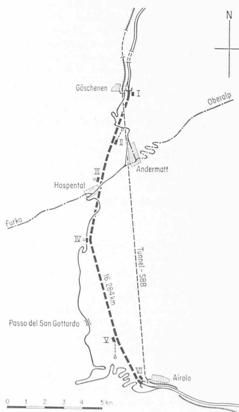
Bild 2. Projekt mit vier Schächten, Lageplan