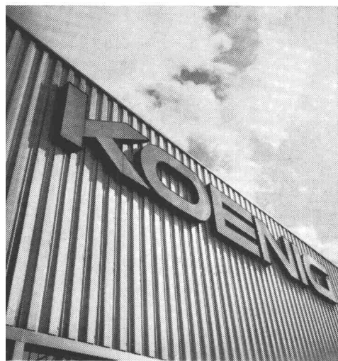
für Fassaden und Bedachungen