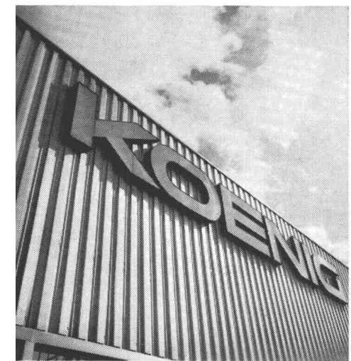
für Fassaden und Bedachungen