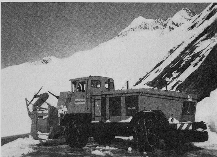
Bild 2. Frontansicht der Beilhack-Schneesleuder Typ HS 292