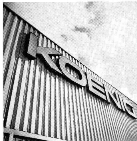
für Fassaden und Bedachungen