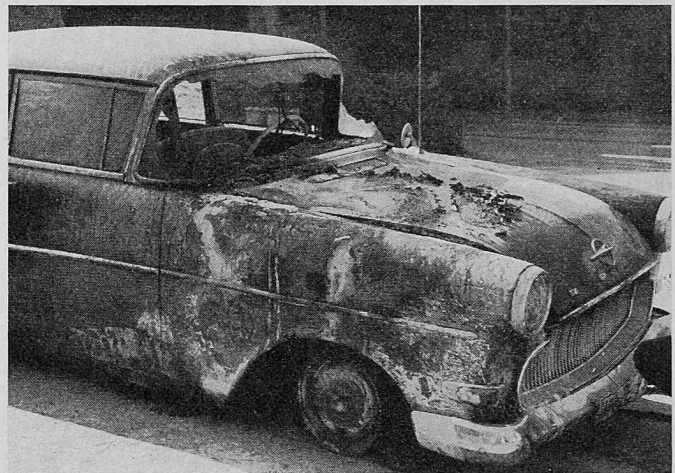
Bild 1. Durch Vergaserbrand im Wagenburgtunnel in Stuttgart beschädigter Personenwagen vor dem Tunnelportal

Bild 2b zeigt den Typ der Halbquerlüftung. Die Ansaugventilatoren transportieren die angesaugte Frischluft längs einem Frischluft-