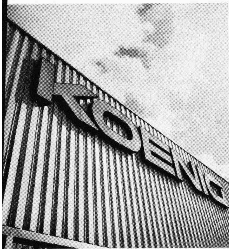
für Fassaden und Bedachungen