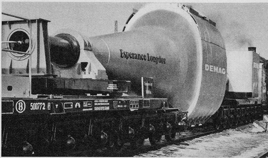
Bild 1. Ansicht des Roheisen-Mischerwagens während einer Versuchsfahrt