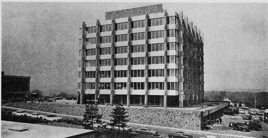
Fassonierungs- und Konfektionierungsgebäude des Geigy Pharmazentrums in Macclesfield, Grossbritannien. In den zwei vollklimatisierten Geschossen dieses Gebäudes werden mittels modernster Anlagen die pharmazeutischen Produkte der Geigy Pharmaceuticals Ltd. hergestellt. Der Preis für dieses Gebäude wurde vom «Civic Trust» verliehen.