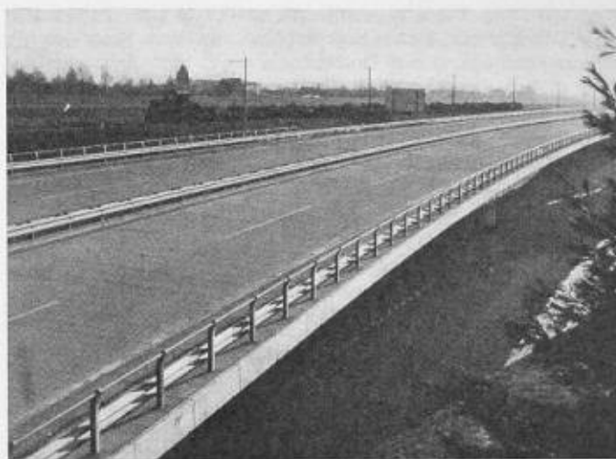
Bild 17. Fertiger Belag