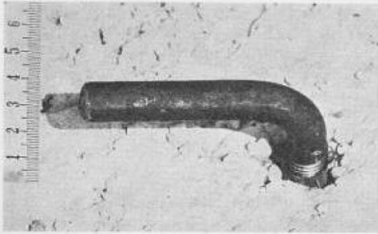
Bild 16. Winkelschraubenanker, im frischen Konstruktionsbeton versetzt. Ansicht und Querschnitt 1:4