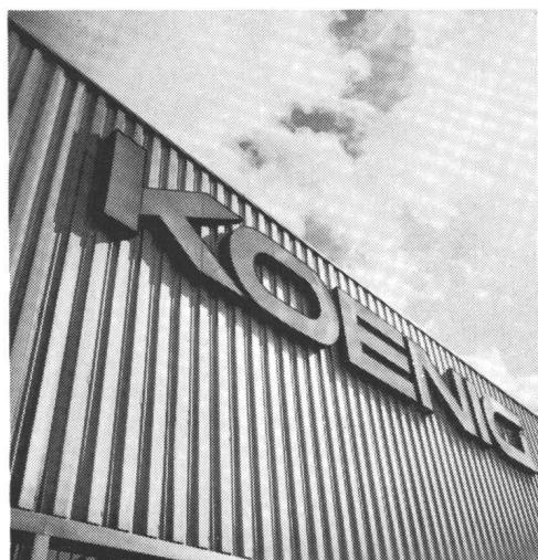
für Fassaden und Bedachungen