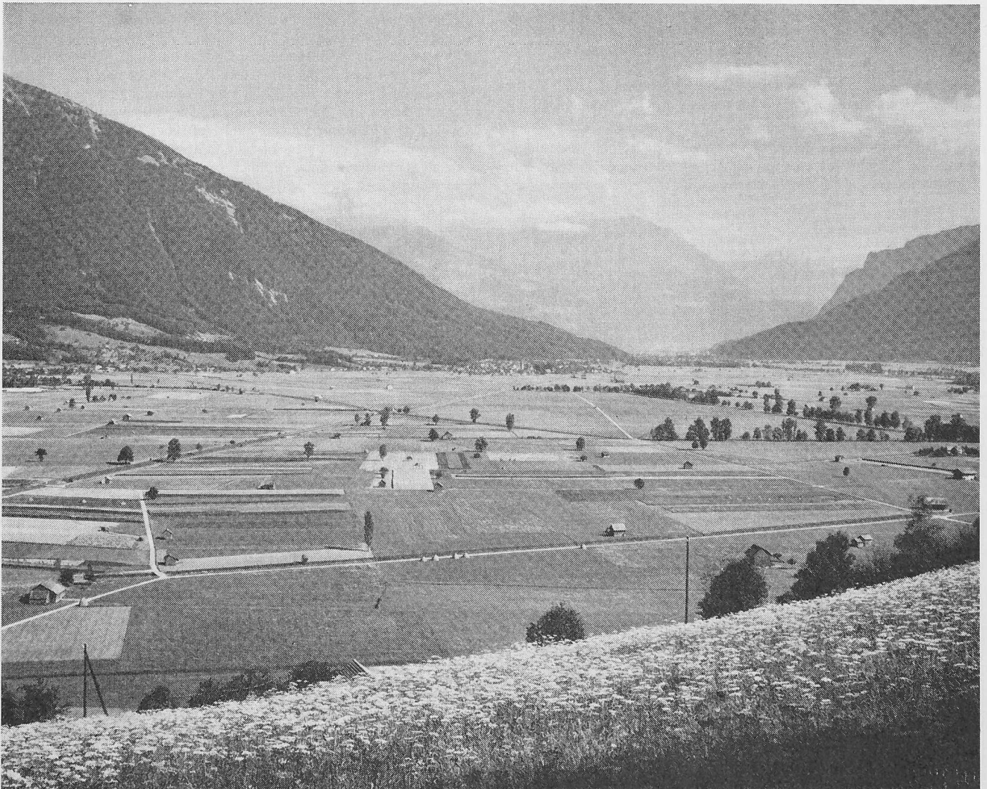
Bild 1. Ausschnitt aus der oberen Linthebene, Schäniser Gebiet

Besonderen Schwierigkeiten begegneten die Besiedlung und Inkulturnahme des neu gewonnenen Landes. Bodenrechtliche Bindungen und die eng begrenzte Auffassung der Zusammenlegungsaufgabe verhinderten bis anhin eine durchgreifende Besiedlung der von den Randgemeinden entferntesten Gebiete (Bild 1). Dank dem Einsatz der Schweiz. Vereinigung für Innenkolonisation und industrielle Landwirtschaft sowie der Aufgeschlossenheit einzelner Ortsgemeinden ist aber wenigstens ein erfreulicher Anfang in dieser Richtung gemacht worden. Es ist zu hoffen, dass die Einsicht in die Notwendigkeit vermehrter Verlegung von Landwirtschaftsbetrieben aus den Randgemeinden in die Kernzonen weiterhin an Raum gewinnen wird, selbst dann, wenn die Realisierung der Aussiedlung über eine neuzeitlich konzipierte, die jeweiligen Wirtschaftsräume hinreichend erfassende Güterzusammenlegung erfolgen müsste. Die dadurch ermöglichte Verbesserung der Agrarstruktur wäre die beste Grundlage für eine rationelle und intensive Nutzung des Bodens. Die vermehrten Investitionen und die Aufwendungen der öffentlichen Hand würden durch Aufstockung zu Familienbetrieben, durch Erhöhung der Erträge und Senkung der Produktionskosten in relativ kurzer Zeit dem Volksganzen wieder zufließen. Dazu käme der nicht zu unterschätzende Beitrag an die Ernährungslage – die Eigenproduktion deckt kalorienmässig nur noch 55% unseres Bedarfes –, der im Hin-