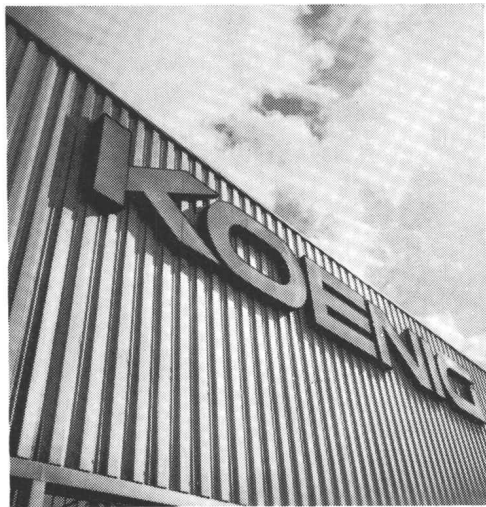
für Fassaden und Bedachungen