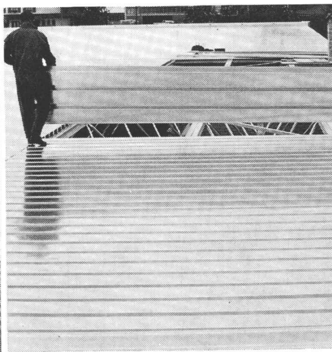
für Flachdächer und Decken

für Tunnel-Auskleidungen und Verkleidungen aller Art (Nationalstrasse N2, Lopper-Tunnels bei Hergiswil)