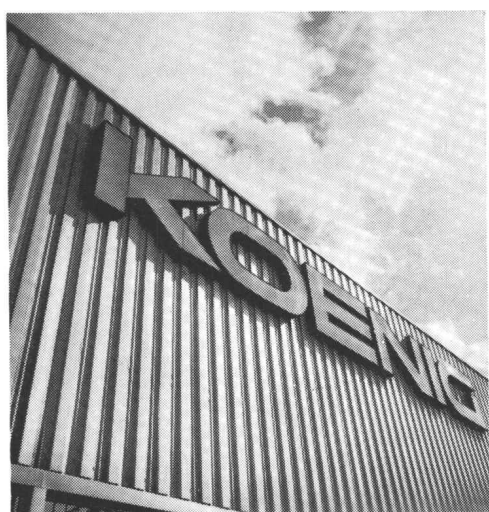
für Fassaden und Bedachungen