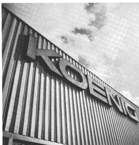
für Fassaden und Bedachungen