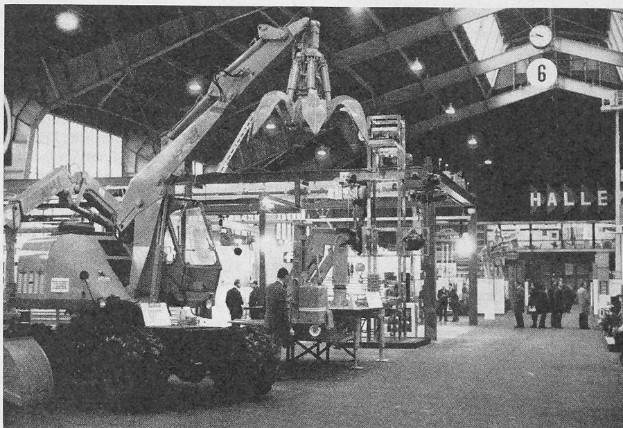
Blick in die Halle 6

Mit anderen Worten: Verzicht auf das hierzulande so beliebte Prinzip: «Jeder macht alles», das einen so unerhörten Verschleiss an Menschen, Geld und Energie bedeutet. Die hier liegenden Produktivitätsreserven übersteigen alles, was bisher innerbetrieblich