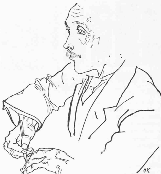
Porträtstudie Adolf Loos von Oskar Kokoschka (1910 im «Sturm» erschienen)