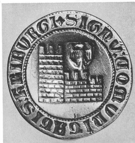
Unten: Sceau de la ville, en argent, de 1469 environ. Au Musée d'Art et d'Histoire (page 17)