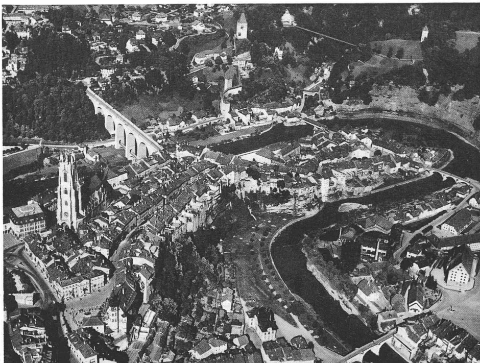
Vue partielle de la ville de Fribourg prise du sud-ouest (page 52)