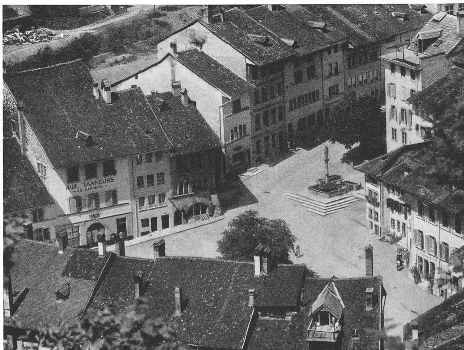
La place du Petit-Saint-Jean, vue de l'est (page 55)