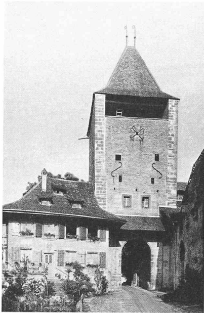
La porte de Bourguillon et son corps de garde, vus de l'ouest (page 143)