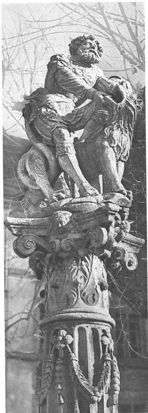
La fontaine de Samson, par Hans Gieng, 1547, à l'emplacement qu'elle occupait avant 1957 (page 223)