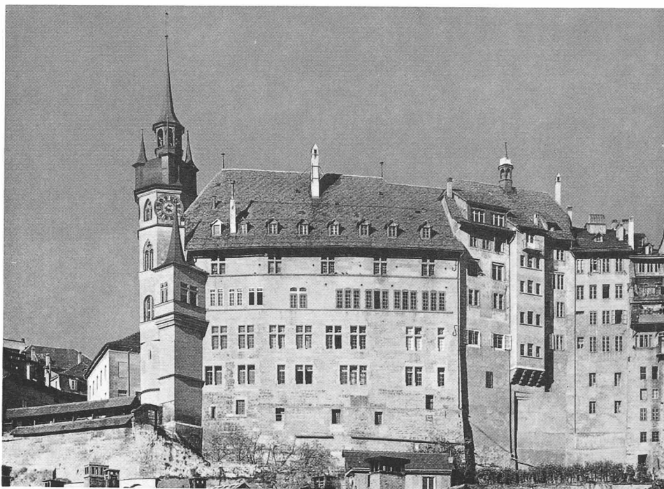
L'Hôtel de Ville vu du sud (état actuel). A sa droite, la façade postérieure de la Maison de Ville (page 269)