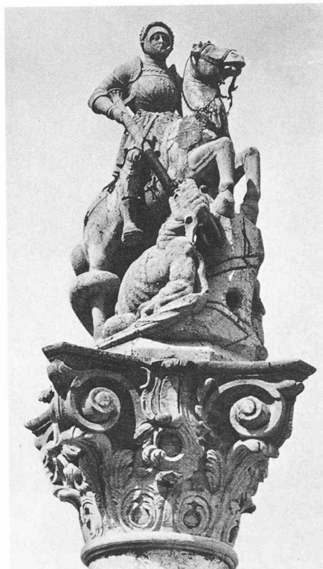
Oben: La fontaine de Saint-Georges; le chapiteau, par Tschupphauer, 1761 (page 219)