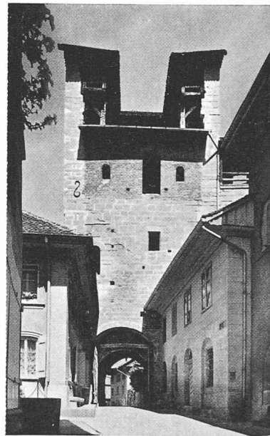
La porte de Berne vue du sud-est (page 107)