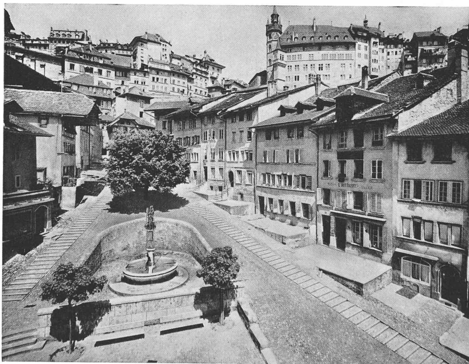
La fontaine de la Force, au bas du Court-Chemin (page 224)