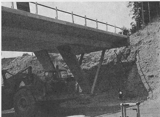
Bild 2. Schrägstiele vor dem Einschütten. Dank dem statischen System von V-förmigen Stützen sind für die Brücken nur zwei Fundamente nötig

Nach erfolgreichen Studien an der ETH betätigte sich der junge Bauingenieur vorerst an einer Reihe grösserer Bauvorhaben. Bei dieser Tätigkeit fesselte ihn rasch, neben den technischen Aspekten, das Problem der eigentlichen Arbeitsausführung mit der Frage nach der Bestgestaltung der einzelnen Arbeitsgänge. Aus diesen besonderen Interessen heraus trat er in den zwanziger Jahren in die Bedaux-Gesellschaft ein, die in Fragen der Arbeitsgestaltung und der Arbeitszeitvorbestimmung in Europa führend war. Entscheidend für sein