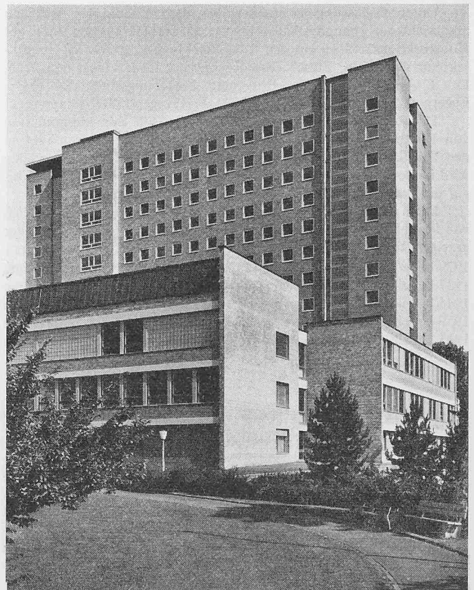
Bettenhaus Kantonsspital St. Gallen. Tragendes Backstein-Sichtmauerwerk 38 cm

Der Hochhausüberbauung in Biel unter Verwendung von HO-Mauerwerk brachte der Verband Schweizerischer Ziegel- und Steinfabrikanten (VSZS) grosses Interesse entgegen. Die Ziegelindustrie ist hierfür nicht nur als Lieferant der in einem Gesamtgewicht von über 3000 Tonnen benötigten Backsteine legitimiert, sondern auch allgemein durch folgende Fakten: ständig weiter fassende Automati-