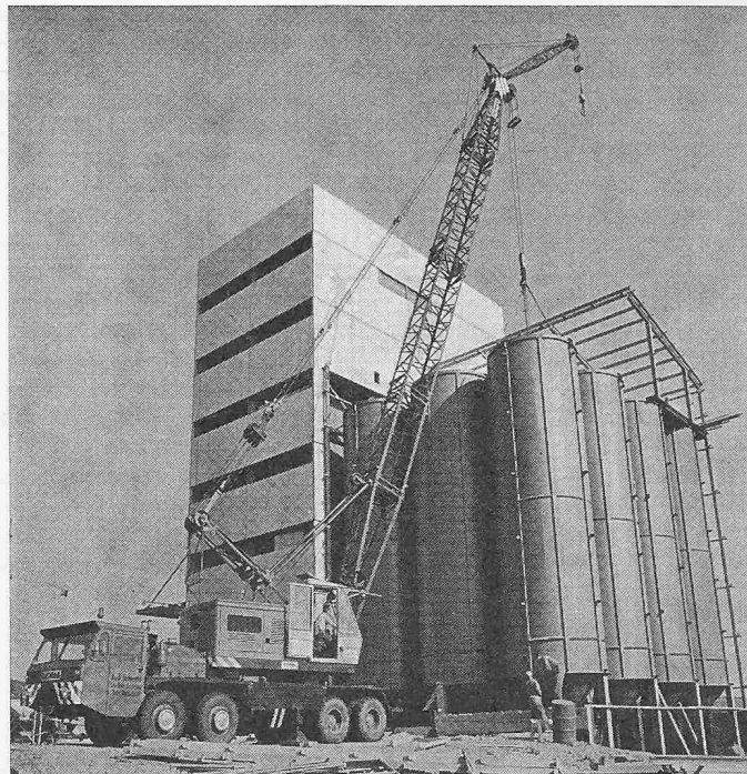
Bild 1. Getreide-Trocknungsanlage bei der SBB-Station Thalheim