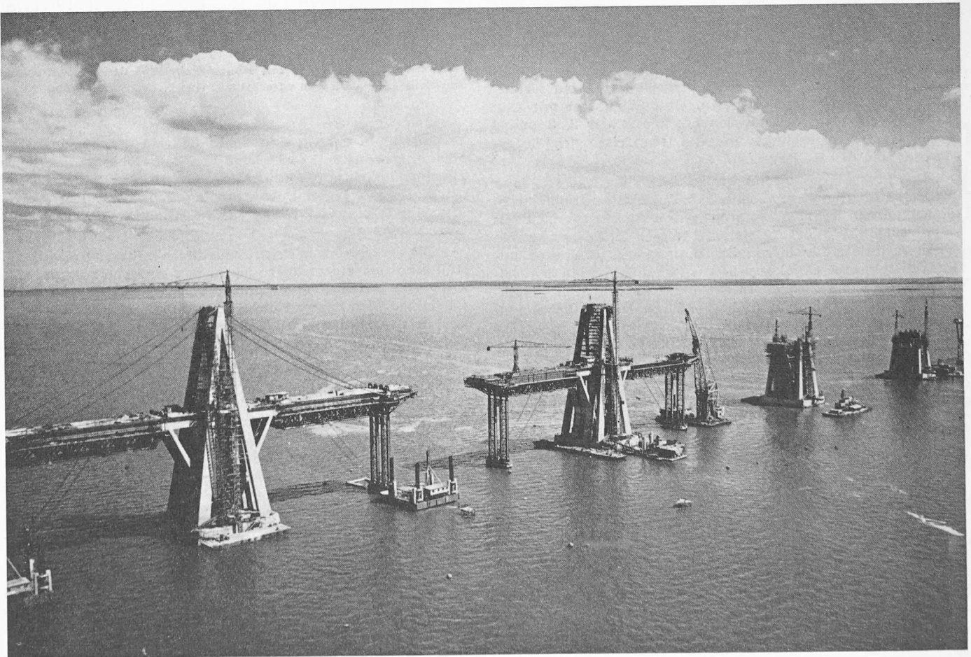
Bild 1. Brücke über den Maracaibo-See, Bauzustände von je 235 m. Die beidseits der Stützenkonstruktion auskragenden Auslegerbalken wurden auf provisorisch abgestützten Schalungsträgern betoniert, da sie erst durch das Spannen der Hängekabel ihre Tragfunktion erhielten

Die von Barcelona nach Nordwesten zu bauende Autobahn zur Erschliessung neuen städtischen Ausbreitungsgebietes unterfährt den 530 m hohen Bergzug des Tibidabo in einem Doppel-Tunnel von 2,4 km Länge. Es stehen hier steil einfallende metamorphe Schiefer des Silurs an, die von Quarzporphyr-Schloten durchzogen sind und ein standfestes Gebirge gewährleisten. Auf Grund dieser geologischen und der topographischen Verhältnisse wurde man zur Entwick-