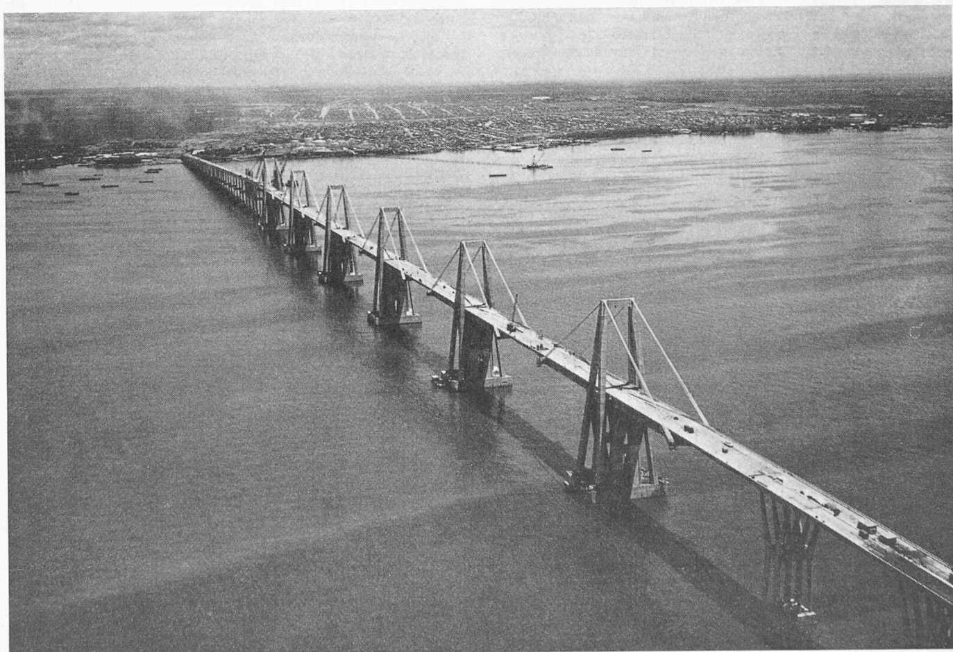
Bild 2. Brücke über den Maracaibosee, Flugaufnahme des fertigen Bauwerks. Im Vordergrund die fünf Mittelöffnungen von je 235 m, im Hintergrund die Stadt Maracaibo (etwa 500 000 Einwohner)