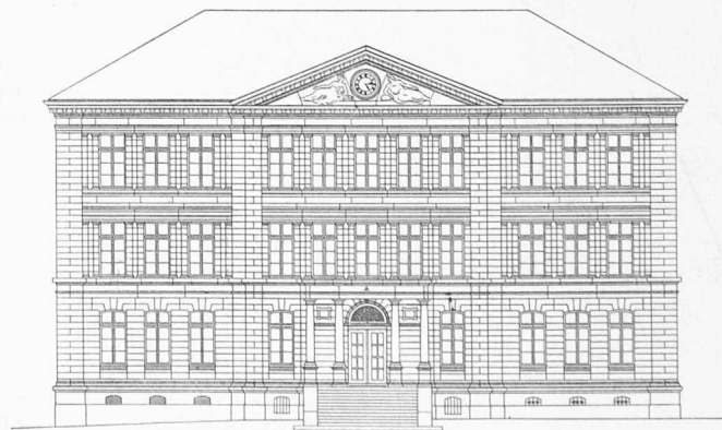
Südwestfassade 1:400 des Schulhauses Ilgen A