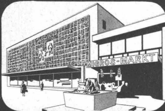
Migros Markt Oerlikon