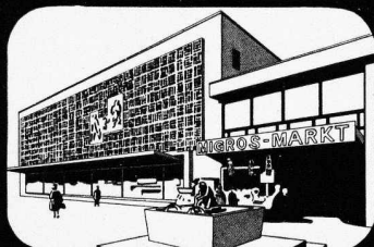
Migros Markt Oerlikon