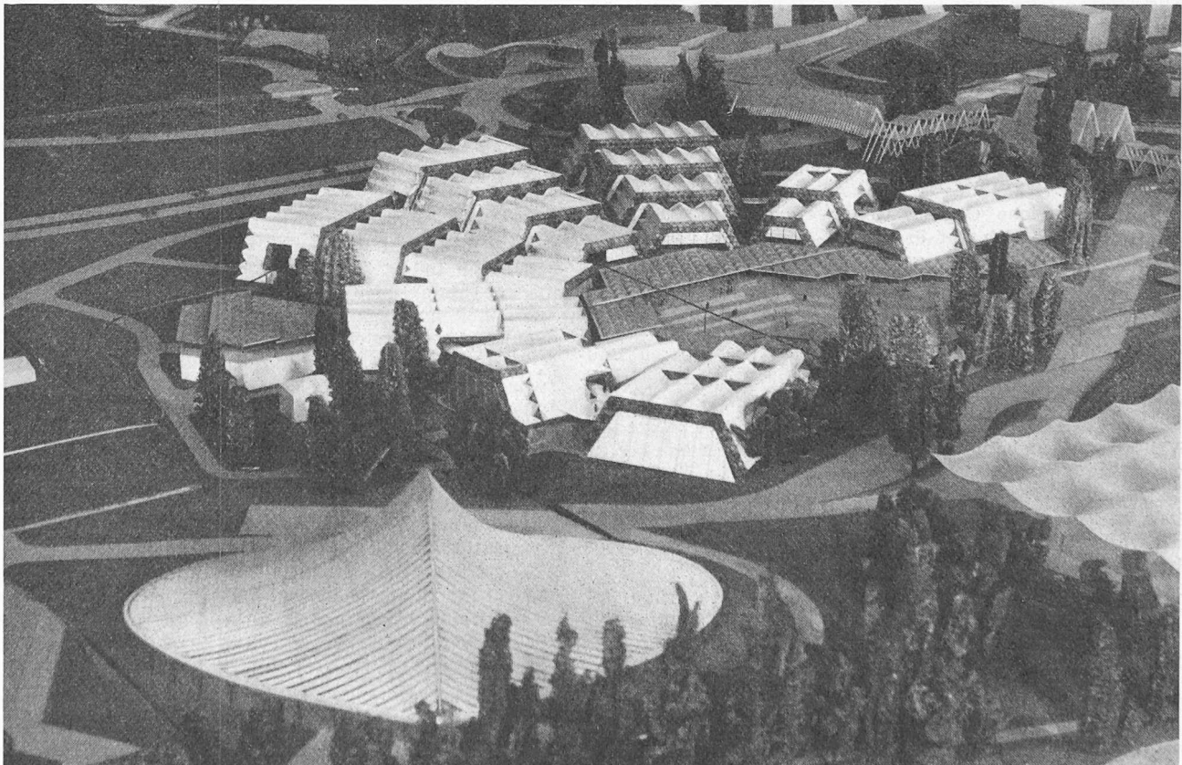
Industrie und Gewerbe. Im Vordergrund die Festhalle

Dieser Sektor, dessen Hauptthema «Die Grundlagen der industriellen und gewerblichen Tätigkeit» heisst, wird die fundamentalen Probleme unserer industriellen und gewerblichen Entwicklung zeigen. Er wird insbesondere darauf hinweisen, wie wichtig es ist, die Fabrikationsprogramme unserer Werkstätten gut aufeinander auszurichten. Diese müssen immer mehr auf die Schaffung hochspezialisierter Erzeugnisse hinarbeiten, die nicht nur durch ihre Präzision und den bedeutenden Arbeitsaufwand, den sie voraussetzen, sondern auch durch den Erfindungsgeist, der ihnen zugrunde liegt, durch technisches Können und durch die zu ihrer Herstellung erforderlichen beträchtlichen Kapitalien gekennzeichnet sind.