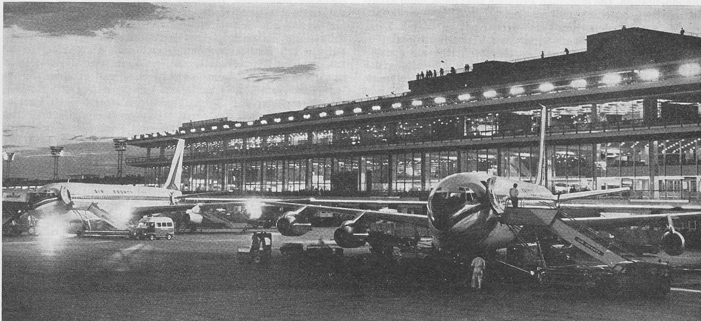
Flughof Orly, Ansicht des Westflügels von Süden