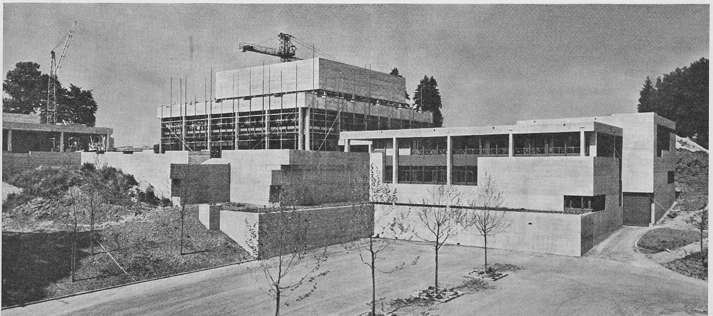
Handelshochschul-Neubau in St. Gallen. Hauptbau, rechts davor Technologie, links Aula. Bauzustand Juli 1962

Für die Finanzierung dieses künstlerischen Planes stehen nur in einem sehr geringen Umfange öffentliche Mittel zur Verfügung. Ein erheblicher Teil des erforderlichen Be-