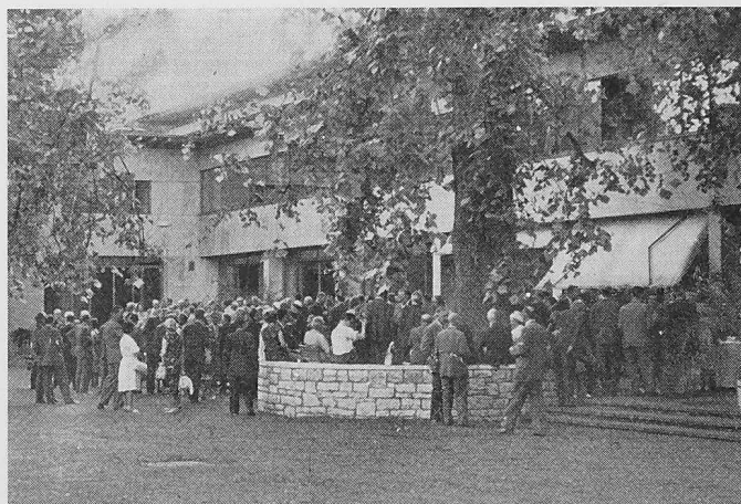
Im Garten der Universität am 22. Juni

Die Kongresshalle der Mustermesse eignete sich vorzüglich als Rahmen für den Festakt vom Sonntag, 24. Juni , den das Basler Kammerorchester unter der Leitung von Dr. P. Sacher mit der Suite und Ouvertüre des ersten Aktes aus «The Fairy Queen» von Henry Purcell eröffnete. Der Begrüssungsansprache des Präsidenten, die im nächsten Bulle-