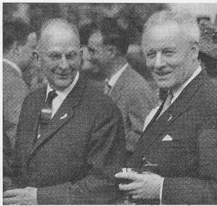
Bundesrat Streuli u. Regierungsrat Zschokke