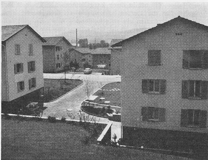
Bild 1. Ausgeführte Quartier-Bebauung eines Vorortes von Zürich.