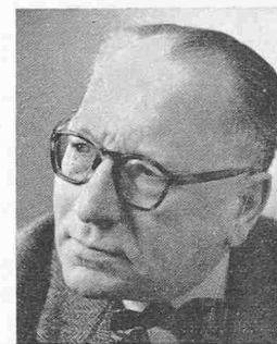
W. F. WILHELM

Der bekannte Verfasser behandelt in diesem Buch in sehr klarer Weise das ganze Gebiet der linearen Schwingungen von mehreren Freiheitsgraden, wobei stets die neue-