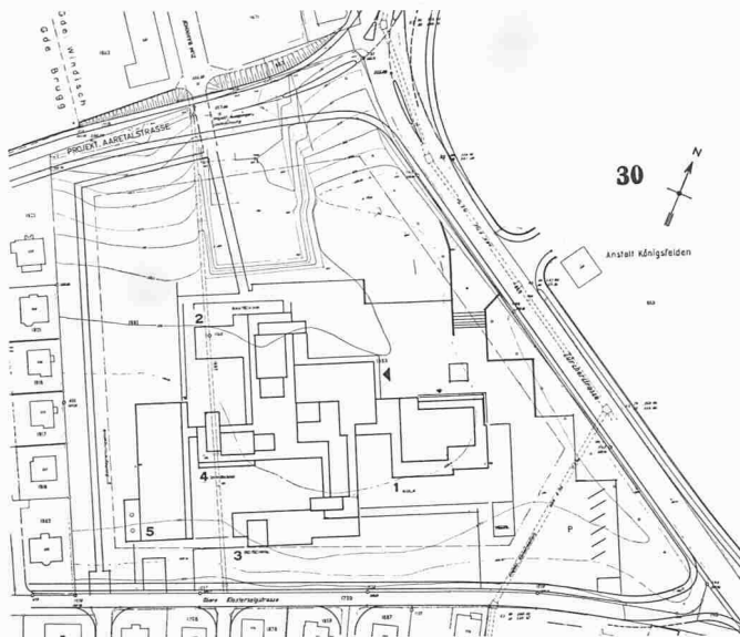
Situation im Wettbewerb, Nr. 30. Legende: 1 Allg. Räume, 2 Bau- technik, 3 Elektrotechnik, 4 Maschinenbau, 5 Maschinenlabor