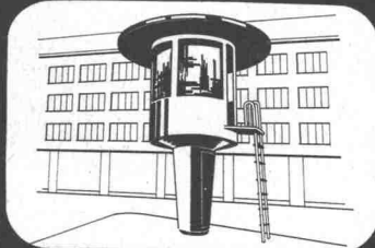
VERKEHRSKANZELN WALCHE UND SIHLPORTE