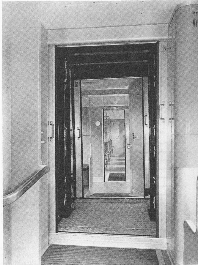
Bild 10. Blick durch einen Wagenübergang

für je vier Plätze 130 bis 150 Lux erreicht. Für den Betrieb vorteilhaft ist der Umstand, dass dank dieser Beleuchtungsart die nötigen Batterieauswechselungen stark verringert werden können.