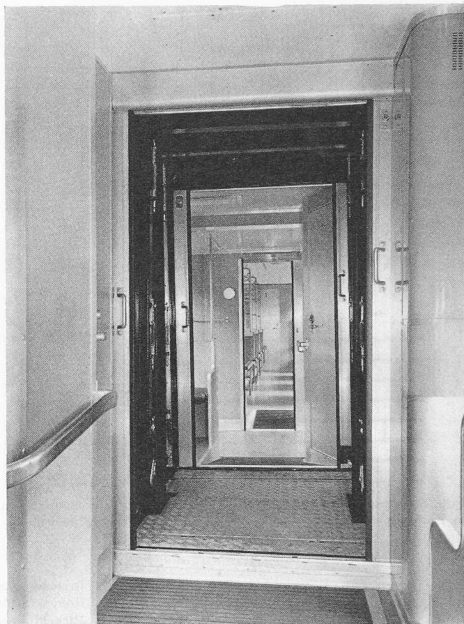
Bild 10. Blick durch einen Wagenübergang

für je vier Plätze 130 bis 150 Lux erreicht. Für den Betrieb vorteilhaft ist der Umstand, dass dank dieser Beleuchtungsart die nötigen Batterieauswechselungen stark verringert werden können.