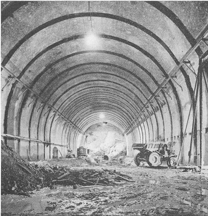
Die Maschinenkaverne Ferrera im Rohbau, Länge 143,5 m, Breite 29 m, Höhe 24 m

keiten verlangt den vollen Einsatz aller am Werk Beteiligten.